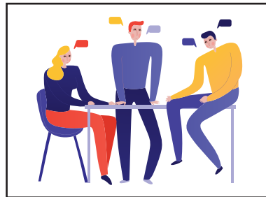
STIMOLARE IL DIALOGO TRA COLLEGHI