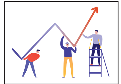
INCREMENTARE LA QUALITA' DEL LAVORO