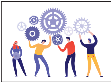
MIGLIORARE L'ORGANIZZAZIONE DI GRUPPO

Vengono organizzati workshop personalizzati per aziende e pubbliche amministrazioni che desiderano creare o migliorare i rapporti collaborativi del proprio staff; i workshop saranno studiati quindi su misura (in relazione ad obiettivi prefissati in precedenza) e possono essere svolti anche all'interno della propria sede operativa.