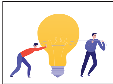
SVILUPPARE E SUPPORTARE LE NUOVE IDEE