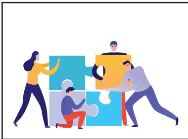
COLLABORARE TRA COLLEGHI